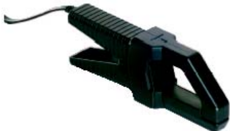
Тип FEA 6044N